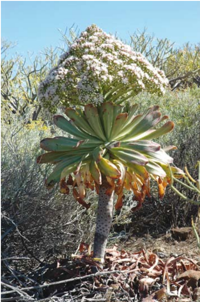
El aislamiento de las islas oceánicas ha propiciado la formación de muchos endemismos. Bejueque endémico de la isla de Tenerife.

la que suele pasar inadvertida, la provocan las especies invasoras introducidas involuntariamente. Es prácticamente imposible revertir la situación, y a lo sumo podemos aspirar a reparar algo del daño causado. Lo que, en principio, sí está en nuestras manos, es no sacrificar más biodiversidad y evitar los impactos innecesarios de cara al futuro. Este es el reto del desarrollo sostenible en cualquier sociedad moderna, sólo que en las islas adquiere un matiz especial. En cierta ocasión, y refiriéndome a mi tierra, escribía: “Canarias no puede ser homologada a un territorio cualquiera. Desarrollar en Canarias es como jugar a la pelota en una tienda de porcelana. Es una cuestión de ciencias naturales, no de chauvinismo” (Machado, 1992). La metáfora es apli-