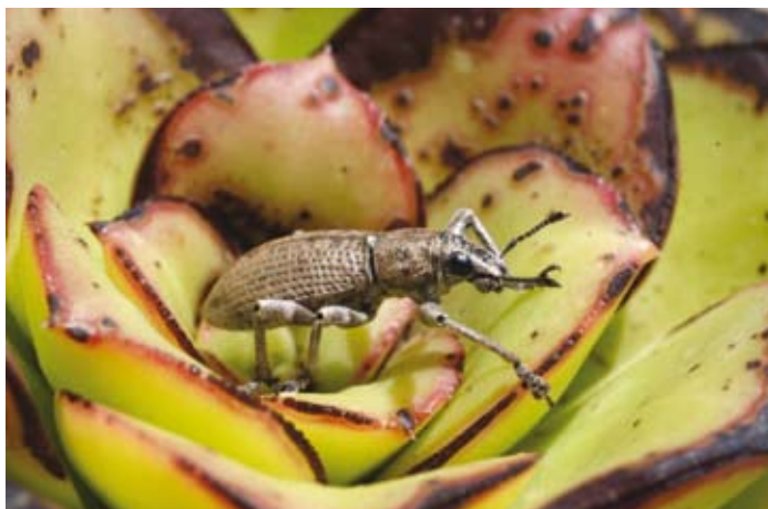
El número de endemismos en islas oceánicas es siempre elevado, particularmente en insectos. Herpisticus , género de gorgojo endémico de las islas Canarias.

nueva tecnología en la que esta audiencia está implicada: la conservación (de la naturaleza), con sus luces y sus sombras.