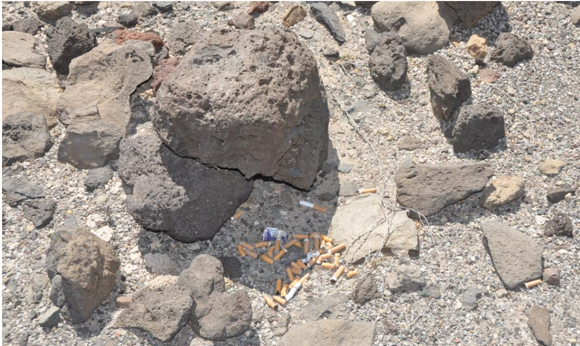
Figura 10. Colillas acumuladas cerca de una de las vallas interiores (16/05/2013)