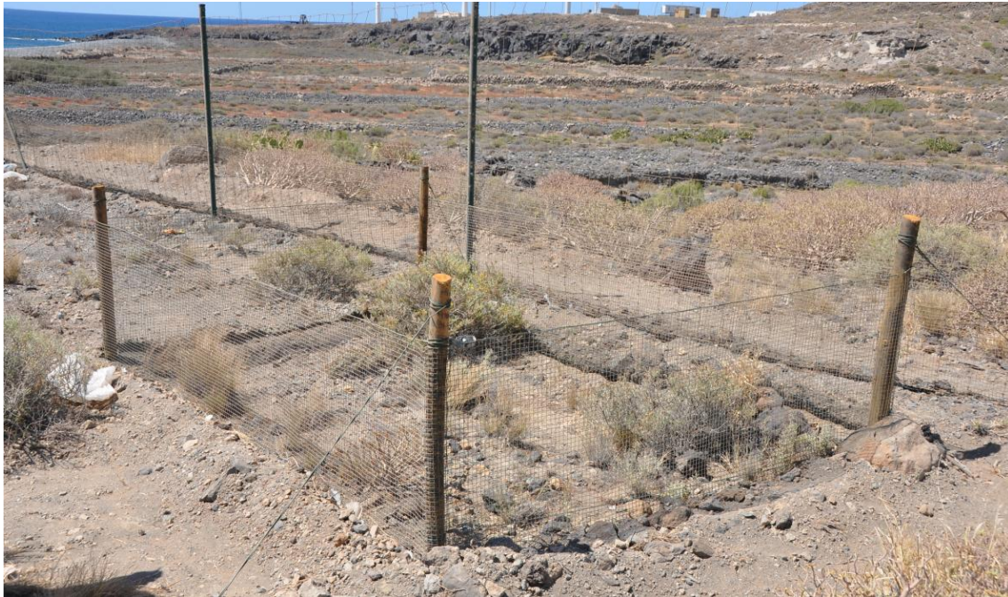
Figura 4. Valla interior (2) con soporte de madera y rejilla plástica (16/05/2013)