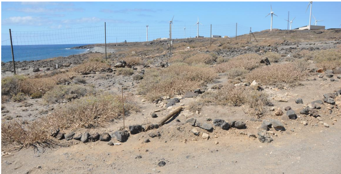
Figura 7. Mismo grupo de plantas (5) sin la valla interior (16/05/2013)