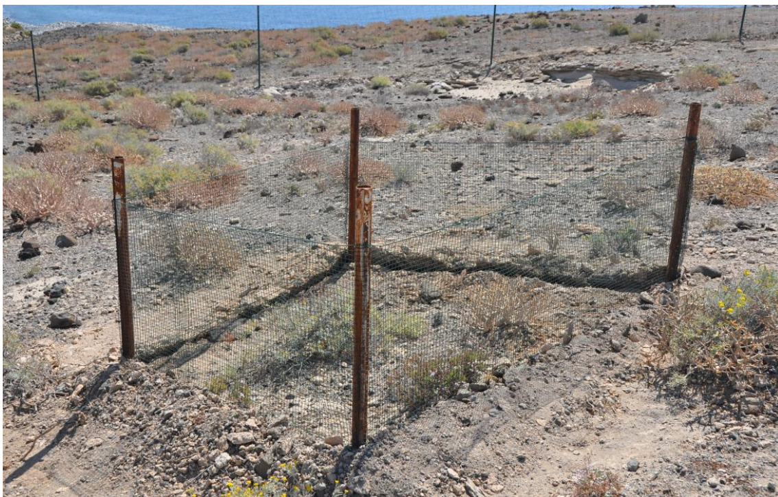
Figura 5. Valla interior con soporte metálico y rejilla plástica (16/05/2013)