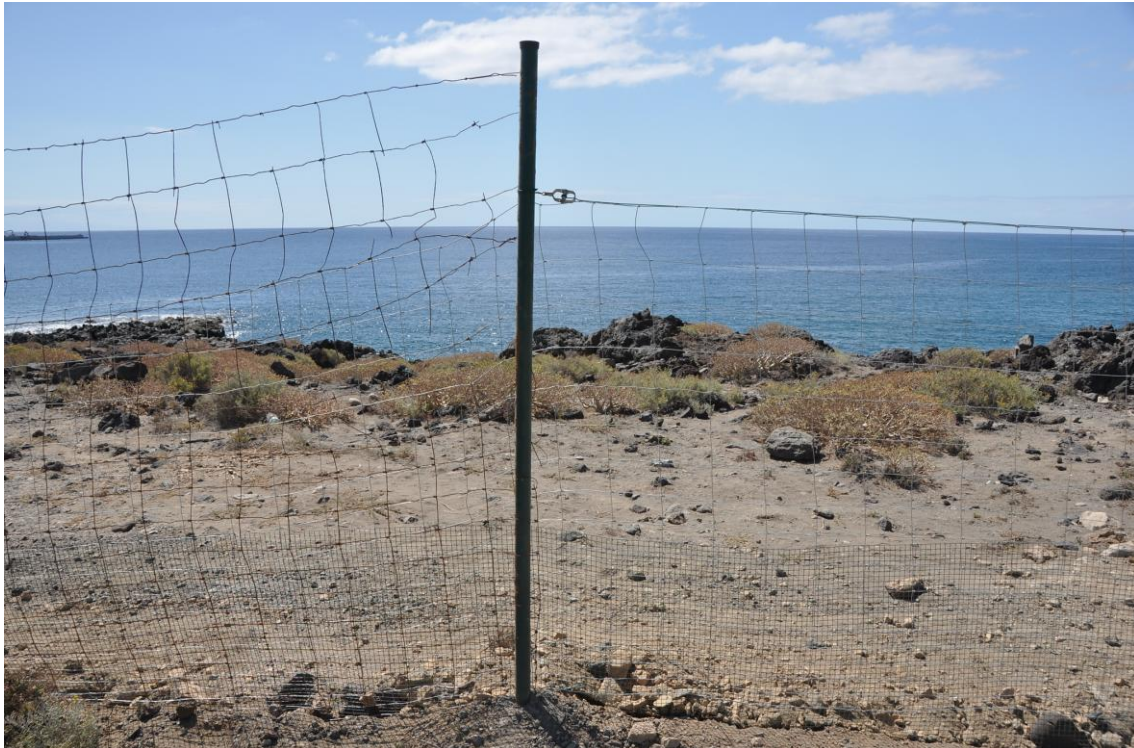
Figura 2. Valla perimetral en una de las zonas reparadas