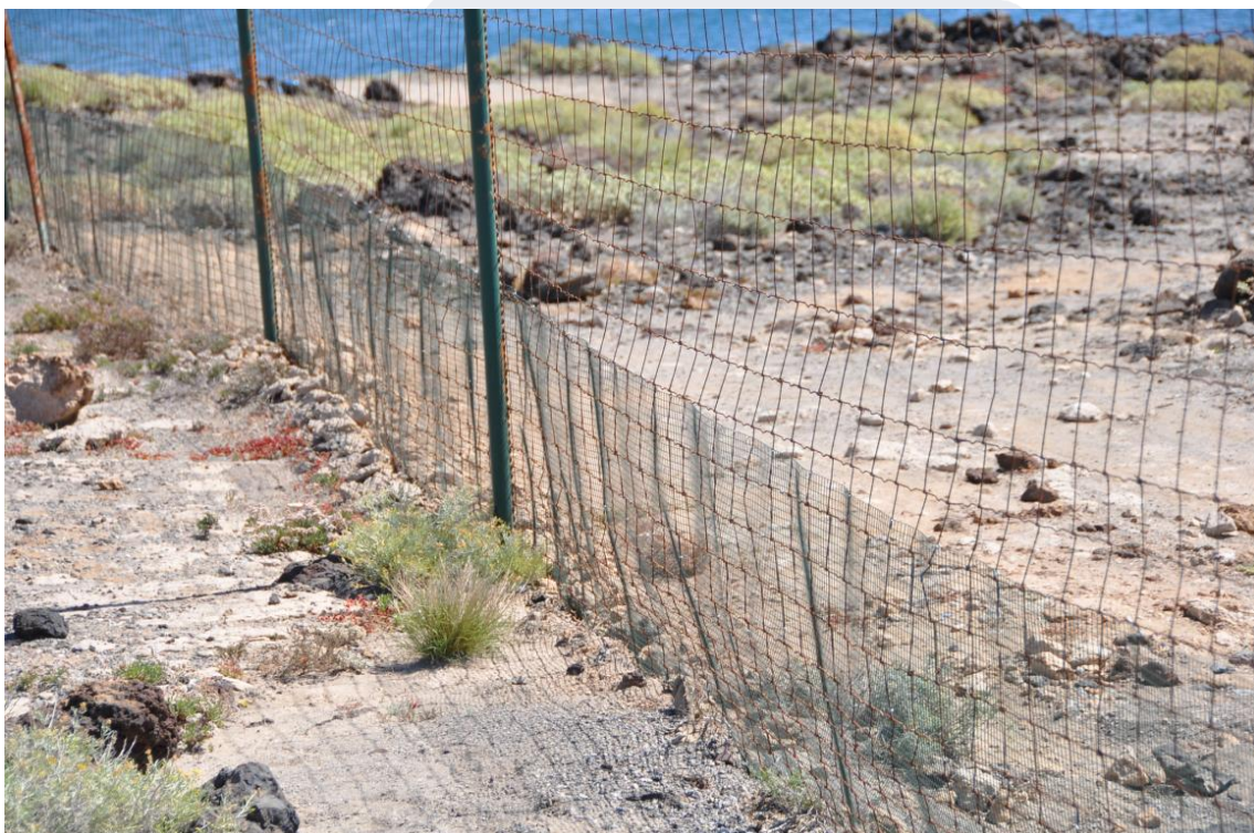
Figura 3. Malla fina en la parte inferior de la valla perimetral