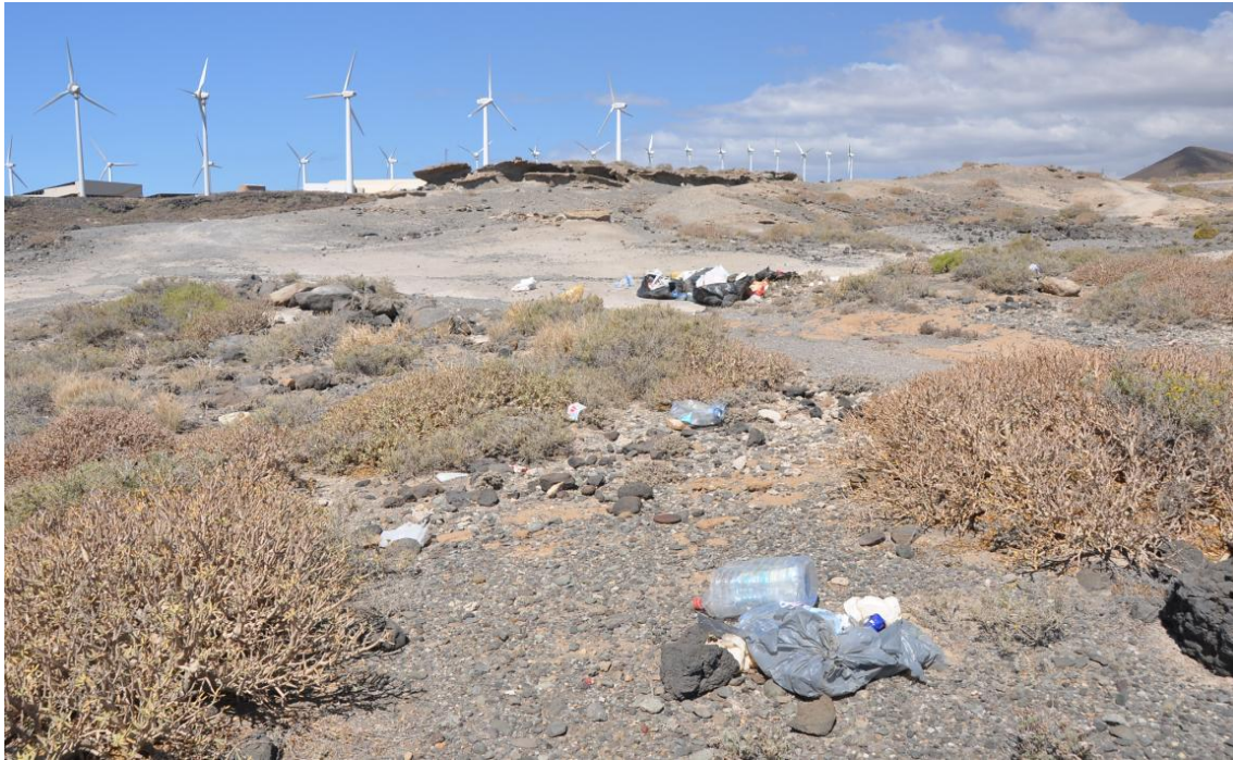
Figura 8. Basuras acumuladas en la zec (16/05/2013)