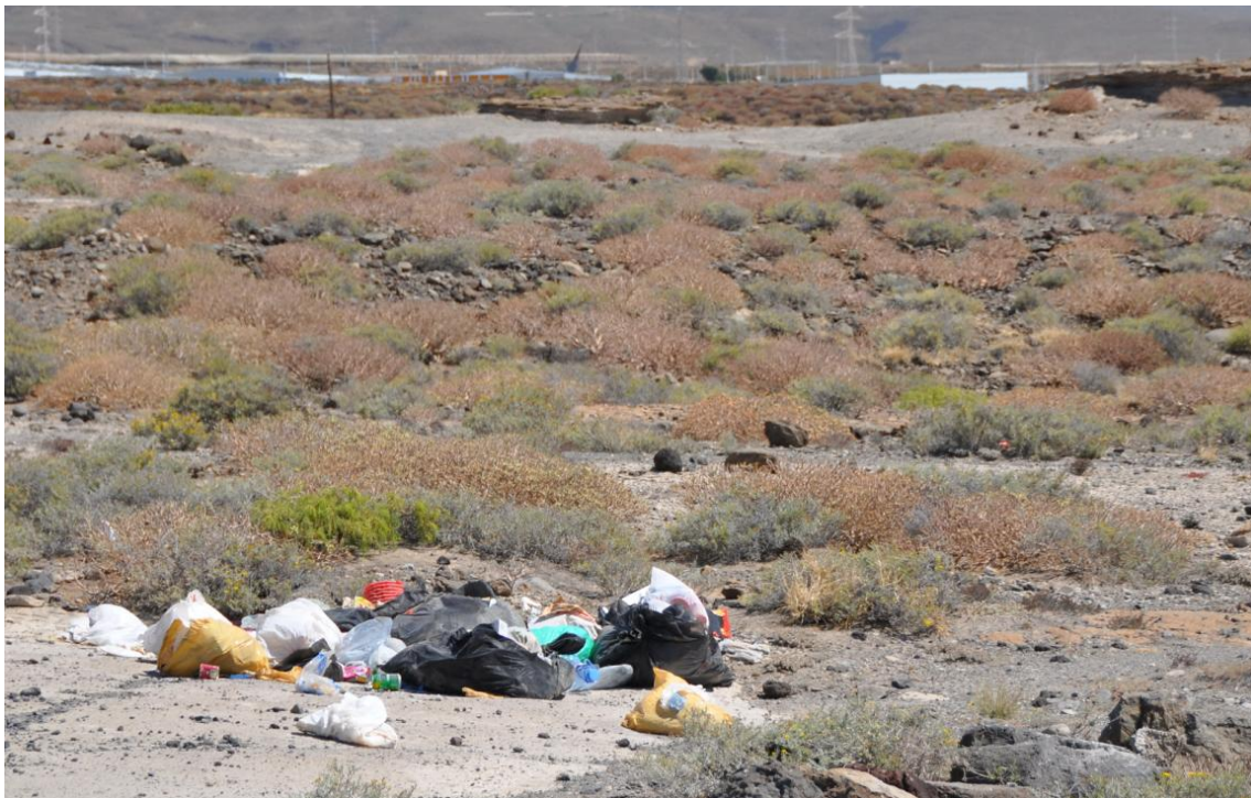
Figura 9. Basuras acumuladas en la zec (16/05/2013)