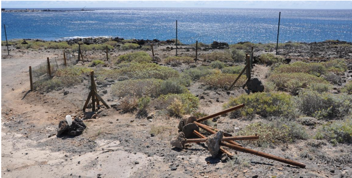
Figura 6. Valla interior (5) con soporte de madera y rejilla plástica (02/04/2013)