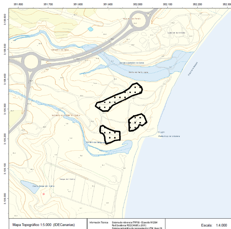
Figura 1. Delimitación de la Zec 64_TF Piña de mar de Granadilla

Con fecha de 19 de diciembre de 2006 el Gobierno de Canarias aprobó la propuesta de acuerdo de Declaración de lic denominado Piña de Mar de Granadilla (Tenerife). En la primera actualización de los lugares de importancia comunitaria de la región biogeográfica macaronésica aprobada por Decisión de la Comisión de 25 de Enero de 2008, se incluye el lic ES7020129 Piña de mar de Granadilla, con lo que se consolida dicha medida compensatoria. Dicho lic se ha integrado definitivamente en la red Natura 2000 tras su declaración como zec 64_TF (zona especial de conservación) en el Decreto 174/2009, 29 diciembre 2009.