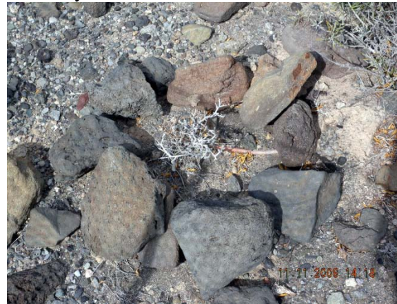
D: Playa del Granadilla 11-11-2009