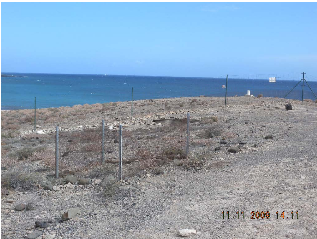
Figura 4. Vallado perimetral e interno para la de protección de ejemplares de piñamar.