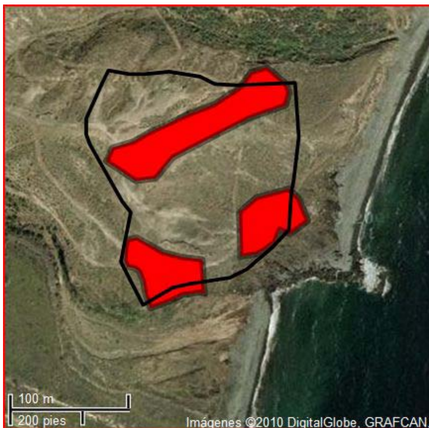
Figura 2. Los Tres Huevos Fritos (N, S y E) de la zec 64_TF en rojo, y el vallado en negro.

El OAG ha constatado que las tres parcelas que conforman el lic fueron rodeadas por una valla perimetral única de 650 m de perímetro, abarcando un área total de 2,65 hectáreas (medición en Google). En la figura 2 se puede apreciar como el área vallada (línea negra) abarca bastante más terreno que los Tres Huevos Fritos (en rojo), quedando, por otra parte, una pequeña porción de éstos fuera del vallado (1.042 m 2 ). Lo importante, es que todos los ejemplares de piñamar detectados se encuentran dentro del recinto vallado.