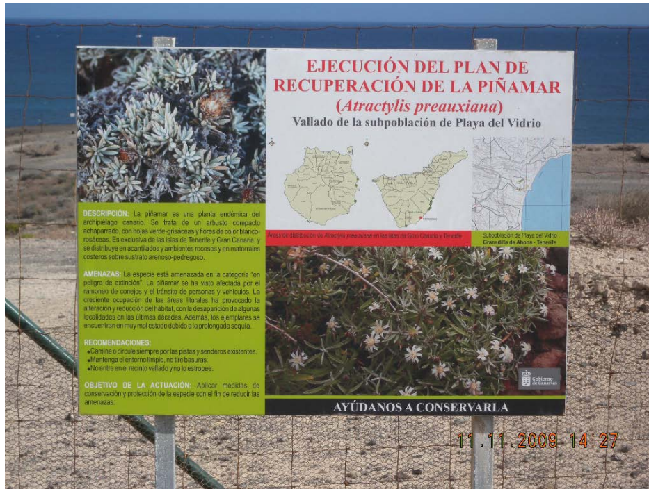
Figura 7. Panel informativo colocado en Playa del Vidrio, Granadilla.

De los cinco paneles informativos previstos para las zonas de vallado correspondientes a Tufia, Taliarte, Lomo de Las Eras, Abades y Playa del Vidrio, sólo se ha colocado este último, por ser el único espacio cuyo cerramiento se ha ejecutado.