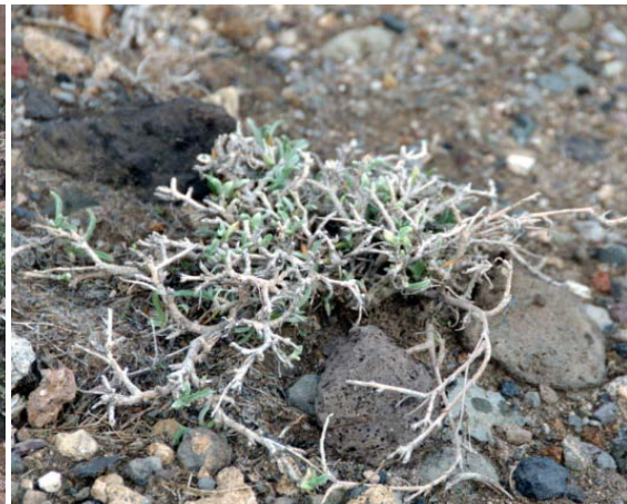
B: Playa del Vidrio, Granadilla, 9-1-2009