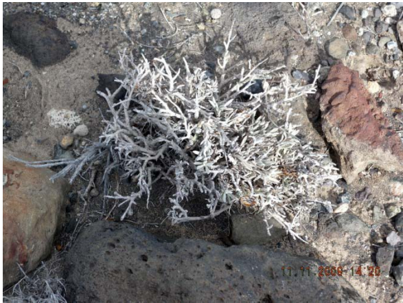
C: Playa del Vidrio, Granadilla, 11-11-2009