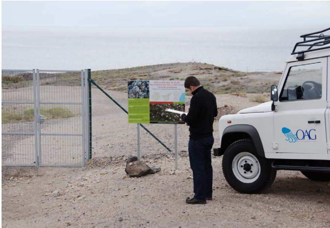
Figura 3. Vallado de la población en Punta del Vidrio, Granadilla, 9 de Enero 2009.