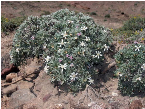
A: Acantilado La Hondura 24-3-2006

En la encomienda de gestión 4 arbitrada para desarrollar el Plan se ha planteado la reintroducción de ejemplares en Montaña Roja, a partir de semillas recolectadas en Playa del Vidrio, El Rincón y Montaña Amarilla. Los ejemplares de Playa del Vidrio se encuentran, a fecha de Enero de 2010, en estado lamentable, sin que se haya apreciado una mejora sustancial en su desarrollo tras el vallado realizado en Septiembre de 2008. Esta circunstancia puede estar relacionada con la escasez de lluvias durante 2009 y, de hecho, la formación de semillas no prosperó.