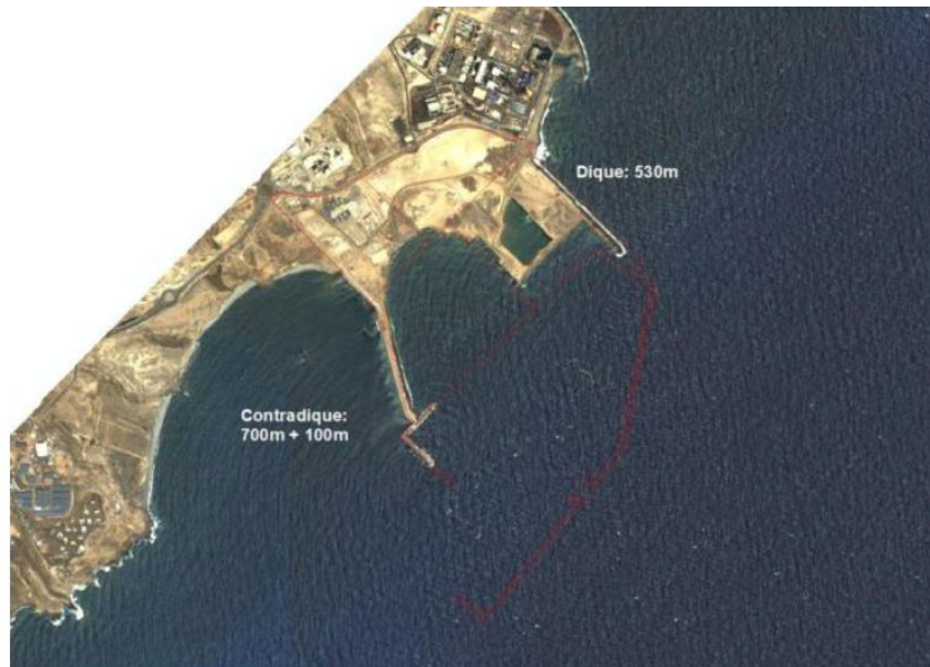
Figura 3. Situación de las obras del puerto de Granadilla a 9 de junio de 2013

En el mes de agosto, una vez colocadas las últimas estaciones de control, se pueden iniciar las pruebas planteadas, o incluso, la liberación regular de arenas si existen razones psico-sociales para ello. No obstante, el OAG propone estudiar el comportamiento de las arenas liberadas a diferentes dosis antes de adoptar un esquema de trabajo continuado.