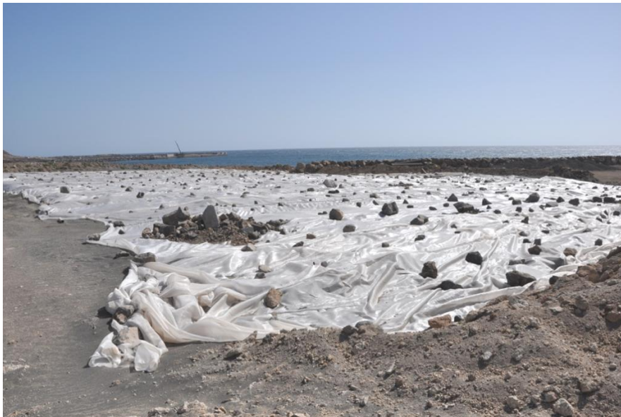
Figura 2. Acopio provisional de arena (cubierta con lona) en la zona de obras (14-2-2013)

Por su parte, y al margen de los captadores de sedimentos ya operativos 1 , el OAG ha procedido a instalar estaciones de control del nivel del lecho marino (cinco estacas decimetradas por estación) para el seguimiento real de las pérdidas o acumulaciones de arena por medición directa. De las ocho estaciones previstas ya se ha colocado seis, y las dos que faltan quedarán operativas a lo largo de este mes (si la mar lo permite).