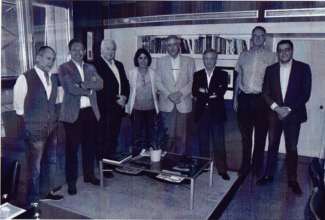
Reunión del patronato del OAG