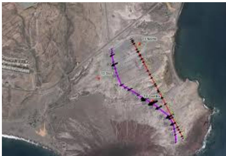
Trampas de arena (cuadrados rojos) y transecto evaluado. Las flechas negras indican la intensidad del flujo en los tramos señalados. Año 2017 (basado en 258 días de medida).

Una vez concluidas las obras de abrigo, el PVA en fase operativa considera la medición del transporte eólico de arenas al menos durante tres años, a fin de detectar una posible merma en el mismo. El OAG ha instalado tres trampas acumuladoras de arena a lo largo de la franja del campo de dunas, para así cubrir todos los días del años. El método empleado se explica en un apéndice del informe anual de 2017.